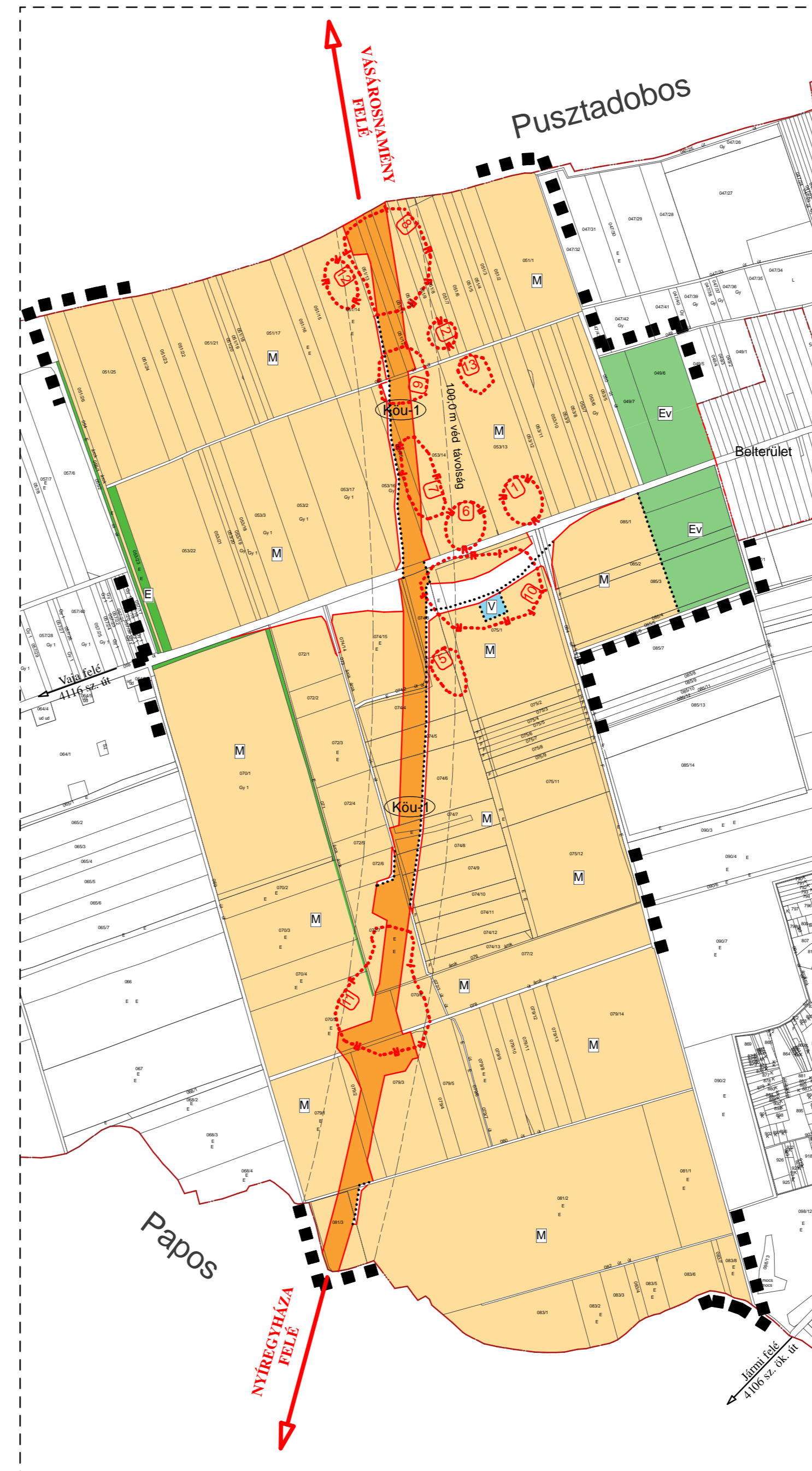
Módosított terv részlete!